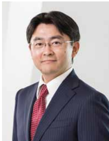
EY 新日本有限責任監査法人 福岡事務所長